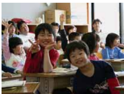
④未来創造のための 人材づくり