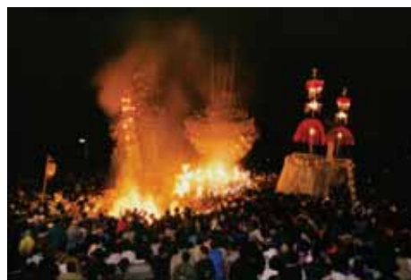
②魅力ある温泉地づくり