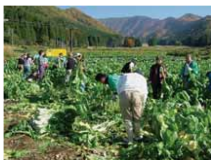
③観光と連携した ブランド農産物 づくり