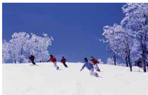
①世界に通ずる スノーリゾートづくり